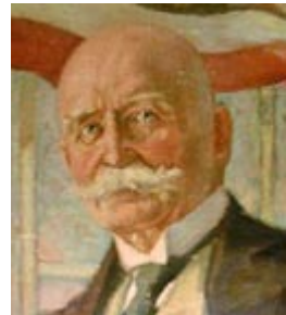
R IV, von Zeppelin