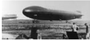
L-44, L-48, Schütte-Lanz