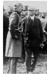
Wilhelm II och von Zeppelin